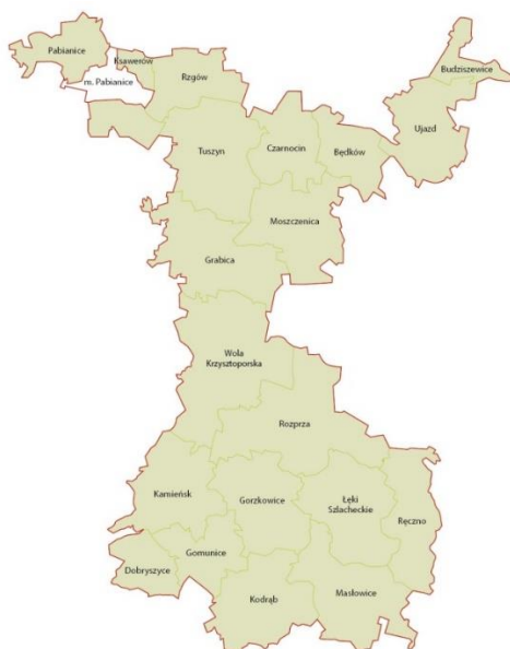
Mapa 1: Gminy członkowskie Stowarzyszenia Lokalna Grupa Działania „BUD-UJ RAZEM”

Gminy tworzące obszar LGD „BUD-UJ RAZEM” to: Będków, Budziszewice, Czarnocin, Dobryczyce, Gomunice, Gorzkowice, Grabica, Masłowice, Moszczenica, Kamieńsk, Kodrąb, Ksawerów, Łęki Szlacheckie, Pabianice, Rozprza, Rzgów, Tuszyn, Ujazd, Wola Krzysztoporska, Ręczno (Mapa 1).